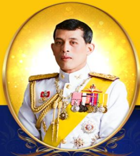
ทรงพระเจริญ